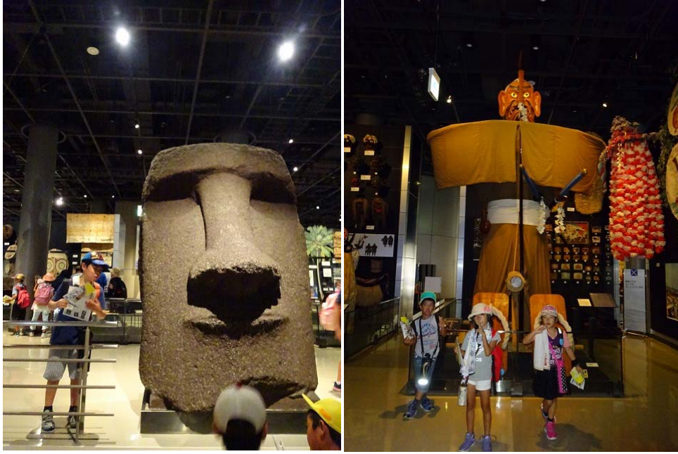
モアイ像と記念撮影！