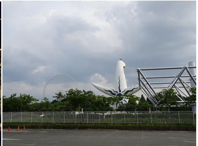
とても大きな船だね！帆に風を受けて進むんだ～！ 太陽の塔を背に、帰宅の路へ