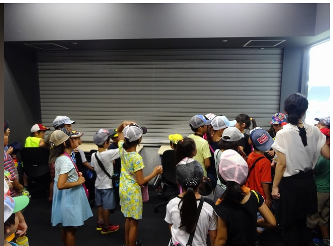
いよいよ、実況中継室からの眺めです！！ わくわく！！