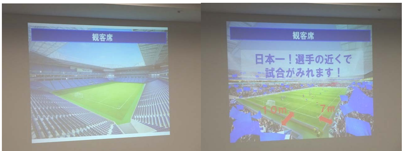
今日はこんなところを見に行くよ～！ 観客席数は長居スタジアムに次ぐ大きさ 観客席とグラウンドの距離は最も近く7m。選手が真ん前で見えるね！