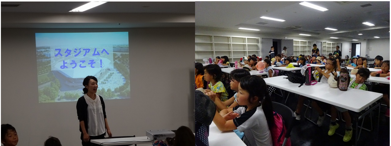
スタジアムの方から詳しく説明を聞かせていただきました。