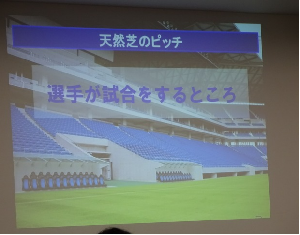
天然芝なので、今日はグラウンドに入れません。残念