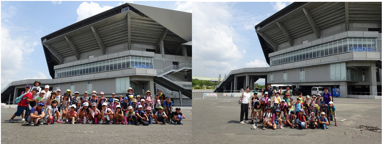
スタジアム前で集合写真！