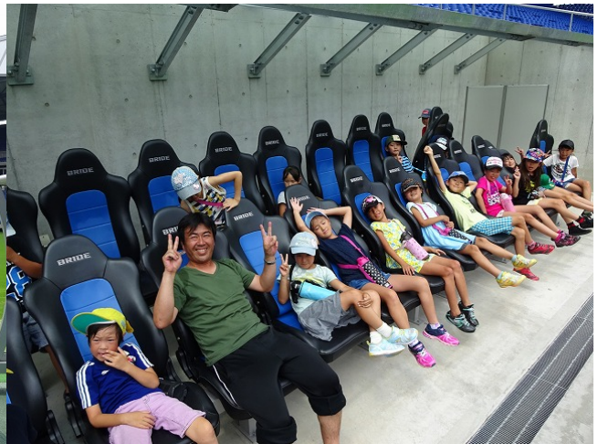
記念撮影して、いよいよ試合開始だ～！ ベンチでこんなにくつろいでいるの見たことないよ！