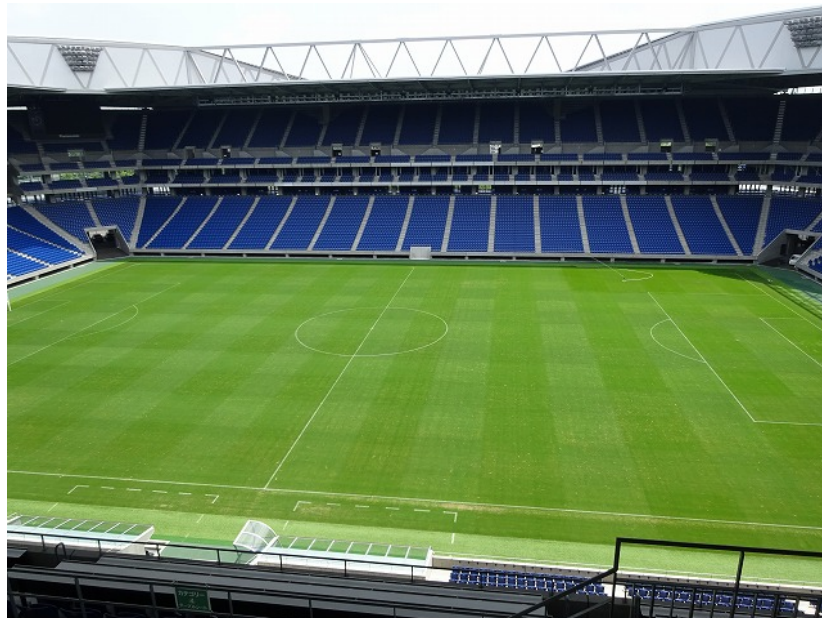
とても広大なパノラマな眺め！凄〜い！！あれ前に窓がないよ。 実況者も、臨場感を味わって実況できるようになっているんだって。