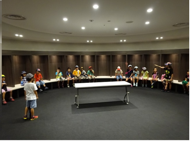
選手控室。アウェーとホームでこんな違いがあるんだ！