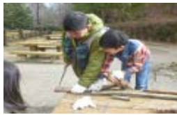
木こり体験 のこぎりってむつかしい...