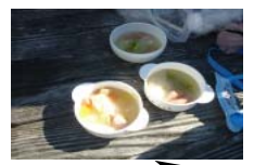
あつあつ かんせい 熱々ポトフ完成！

1月20日(土)に小学生対象で「木こり体験」と「ポトフ作り」を開催しました。 林の中で間伐材を探し、同じ枝でも「重い」「軽い」や「硬い」「軟らかい」などの違いを体験したり 実際にのこぎりで木を切り、切った木片を使ってクラフトをしました。普段、用意されている材料を使って 作る時よりも、自分たちで探して切った木片を使うことで最後まで無駄なく使おうとする姿を見て何事も「経験」なんだと 改めて実感しました。3月は乳幼児親子から小学生全般的にを対象に1年間の締めくくりの活動を計画中です！！