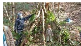
バームクーヘン、燻製と楽しみました!