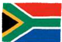
南アフリカ共和国